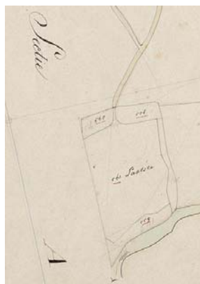
Onder: Sectie A, 4 e blad, het perceel met het kadastrale nummer 561 ('laatste' van sectie A, 1 e blad) is de locatie van de latere fabriek. Dit perceel behoorde toe aan de Provisorie van Eibergen die toen nog (gedeeltelijk) onder burgerlijk bestuur stond.