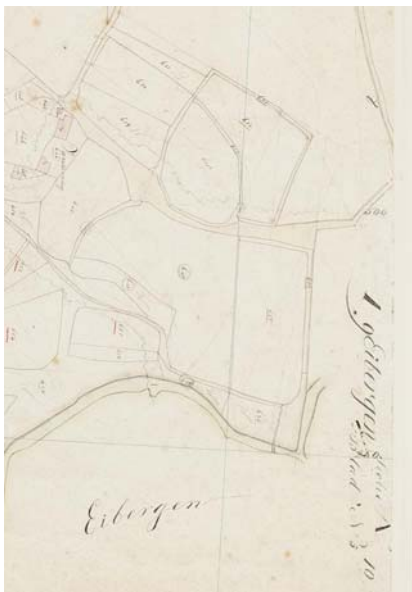
Kadastrale situatie 1828, vóór de komst van Bouquié: links: Sectie A, 5 e blad, Mallem. Rechtsonder, links van de bijna haakse bocht van de Berkel, is het oude hoge vonder getekend. Rechtsboven erve Vunderink.

Inderdaad kwam die brug er en werd de mark van een duur probleem verlost. Daarvoor was financiële steun nodig van de provincie en het Rijk. Daarom duurde het nog drie jaar (en veel plannen en wijzigingen verder) voordat de nieuwe vaste oeververbinding in gebruik genomen kon worden. Meer nog: de brug was het begin van de huidige en bijna 'oude' N18.