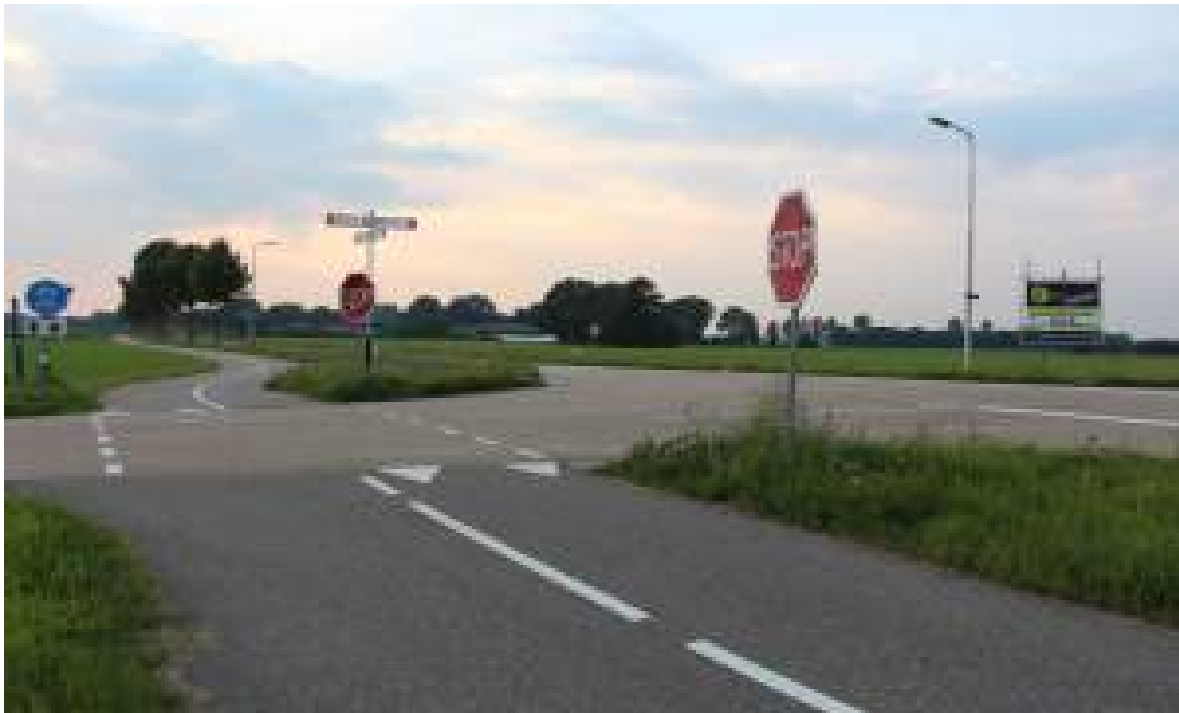
De kruising Borculoseweg-Stokkersweg in de richting Haarlo. Op de achtergrond de door de tornado van 1 juni 1927 zwaar getroffen boerderijen Bosman en Boak

Weinigen zullen zich realiseren dat het nieuwe tracé van de N18 tussen de Kormelinkweg en de Berkel in Olden Eibergen zo ongeveer de baan van de windhoos van 1 juni 1927 volgt. Nog geen twee jaar na de stormramp van Borculo (10 augustus 1925) werd onze regio opnieuw getroffen door een windhoos, die tegenwoordig ingeschaald wordt als een heuse tornado in klasse 4 op de schaal van Fujita: de op een na hoogste klasse. Het was een geluk bij een groot ongeluk dat de tornado over het platteland en over het industrieterrein annex spoorwegemplacement van Neede trok. Van het overtrekken van de tornado door Olden Eibergen is een levendig ooggetuigenverslag bewaard gebleven. Dat verslag is nu nog 'herbeleefbaar', maar met de komst van het viaduct ('Olden Eibergen') over de Borculoseweg op de Oldeneibergse Es, zal ook dat definitief tot het verleden behoren.