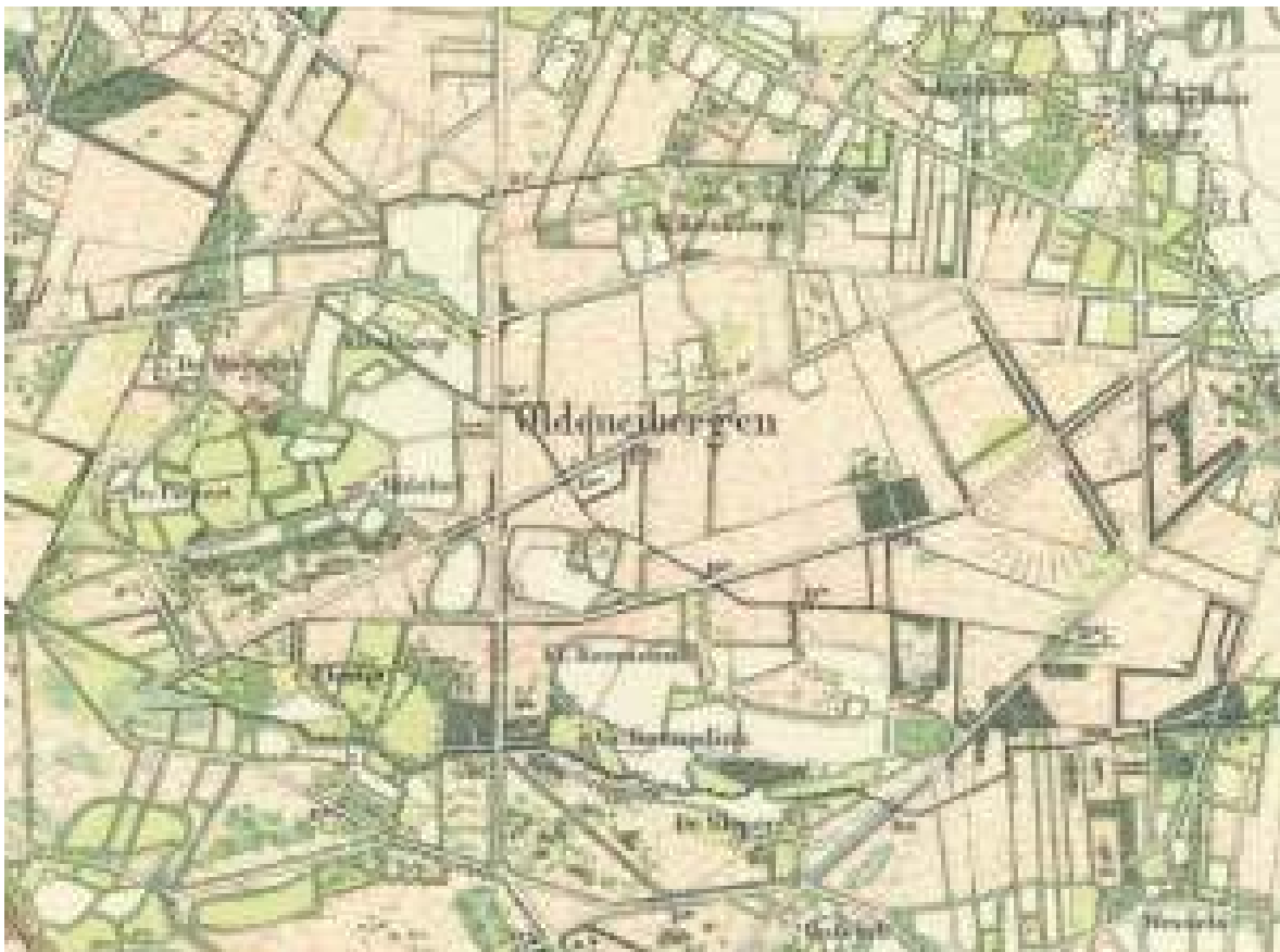
Detail van een topografische kaart van Olden Eibergen uit ca. 1890. De gaffel- en radialenstructuur van het wegenpatroon in de verdeelde, maar grotendeels nog niet ontgonnen mark is herkenbaar.

De negentiende eeuwse markenverdelingen zijn een eerste vorm van grootschalige landinrichting (voorheen 'ruilverkaveling' genoemd). De voormalige markegronden zijn nu nog herkenbaar aan hun lange rechte kavel- en wegstructuren, nieuwe typen van boerderijen die in tegenstelling tot de meeste oude boerderijen, met het woonhuis naar de weg staan of langs zij. Naast de verdeling van het onverdeelde land onder de gerechtigden (vooral de grote landbezitters profiteerden) van de mark moesten ook nieuwe wegen aangelegd worden en de waterafvoer verbeterd worden.