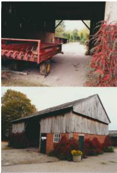
De karakteristieke kapschuur op Nieuw Biezebeek aan de Stokkersweg, ca. 1995.—De karakteristieke kapschuur op Nieuw Biezebeek aan de Stokkersweg, ca. 1995.

De koper is inmiddels ook al weer vertrokken, maar niet nadat alle varkensschuren, op het aan de boerderij aangebouwde 'varkenshuuske' na, gesloopt waren. De karakteristieke deels open kapschuur, die is helaas dichtgemaakt. Bijzonder aan die schuur was, dat de planken van de bovengevel uit één populier gezaagd waren. Over een paar jaar loopt de nieuwe N18 nagenoeg diagonaal over de gronden achter de boerderij, gronden die ooit deel uitmaakten van het in 1299 voor het eerste genoemde erve Biezebeek.