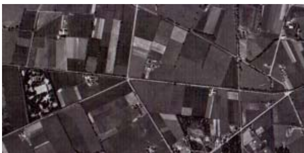
Detail van een luchtfoto uit 1951 met links het voormalige Arbeidskamp