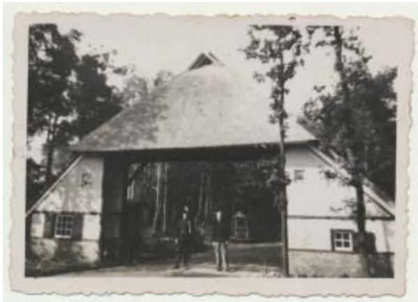
De toegangspoort van het Arbeidskamp 'Los Hoes' Eibergen aan de Lintveldseweg. In de poort een wachter met de schop op de schouder (1943). In 1948 stond dit gebouw er nog.