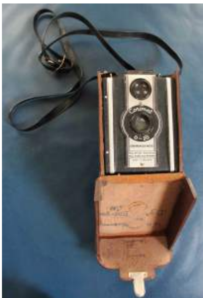
Het tussen 1943 en 1955 veel gebruikte fototoestel van mijn vader, W.H. te Vaarwerk.

Grootvader bleef naast veehouder vooral ook kippenboer, zoals op veel foto's uit het familiealbum is te zien. In de Bosweide achter het huis werd ook een kippenhok gebouwd, dat wij het 'achterste hennenhok' noemden. Het is alweer jaren verdwenen, maar de nieuwe N18 zal er over enkele jaren overheen gaan. De nieuwe autoweg zal ook nog over de 'Heugte' lopen, de hoge bouwkamp aan weerszijden van de huidige Leugemorsweg. De Leugemorsweg zal richting Stokkersbrug verlegd worden over juist dat deel van die bouwkamp dat mijn grootvader ooit bebouwde.