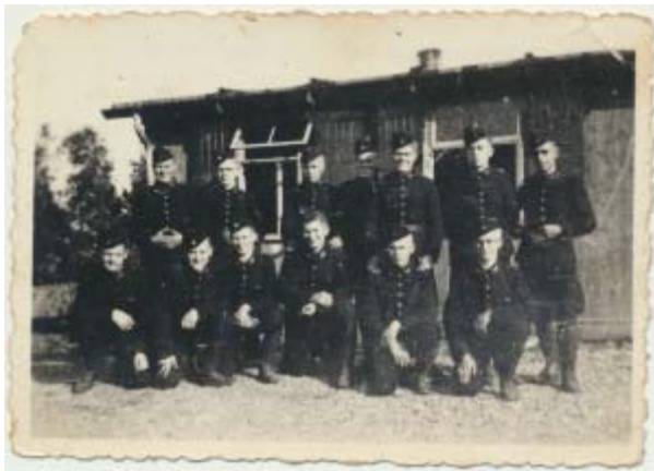
Een gedeelte vaneen ploeg (die normaal uit 16 mannen bestond) van een barak op 't Arbeidskamp.

Het Eibergse Arbeidskamp (met het nummer 323) was één van de twee kampen in de huidige gemeente Berkelland (het andere was gevestigd in Neede). Het werd gebouwd op een nog onontgonnen veldperceel dat gehuurd werd van de Oldeneibergse landbouwer Kolthof. Het werd het 'Los Hoes' genoemd, naar het boerderijtype dat in Nedersaksische streken veel voorkwam en gekenmerkt wordt doordat mens en vee onder één dak wonen, zonder scheiding van woning en bedrijfsdeel. De naam paste dus wel in de Nazi-ideologie. De toegangspoort was al evenzeer 'Saksisch' van aard of moest in ieder geval die indruk wekken. De bouw begon in 1941 en in juni 1942 werd het kamp in gebruik genomen. Er was plaats voor 192 mannen. Het complex bestond uit een vijftal woonbarakken rond een appelplaats met een vijver. Daarnaast een keuken, ziekenbarak, wasplaats en enkele andere gebouwen. Het kamp bleef in gebruik tot 6 september (daags na 'Dolle Dinsdag') 1944. Vier dagen later werd de NAD opgeheven. De leiding van het kamp woonde in van Joden in beslag genomen huizen. Zo hoptman Van 't Hooft in Borculo in villa Dorcia van de joodse familie Elzas.