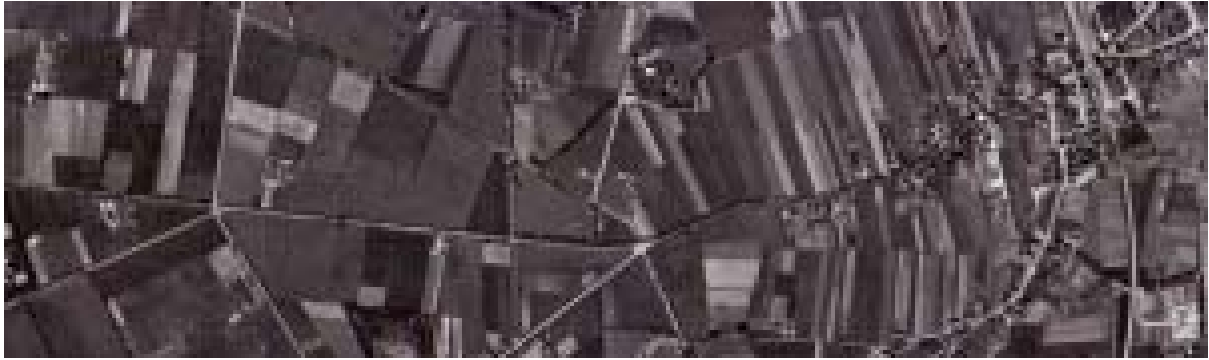
Detail van een luchtfoto van Eibergen (rechts) en Olden Eibergen uit 1951. De gaffelstructuur en de radialen zijn duidelijk herkenbaar in het landschap.

De negentiende eeuwse markenverdelingen zijn een eerste vorm van grootschalige landinrichting (voorheen 'ruilverkaveling' genoemd). De voormalige markegronden zijn nu nog herkenbaar aan hun lange rechte kavel- en wegstructuren, nieuwe typen van boerderijen die in tegenstelling tot de meeste oude boerderijen, met het woonhuis naar de weg staan of langs zij. Naast de verdeling van het onverdeelde land onder de gerechtigden (vooral de grote landbezitters profiteerden) van de mark moesten ook nieuwe wegen aangelegd worden en de waterafvoer verbeterd worden.