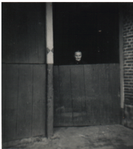
Cobe van de Beezebekke in de nendeure (ca. 1950)

Boerderij Florian in Olden Eibergen lag eveneens in de baan van de tornado.